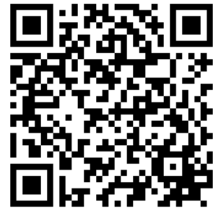
↑ 研修会申込ページ QR コード

※なお、申込者への受付通知は致しませんので 当日筆記用具と電卓をお持ちになって 直接会場へお越し下さい。