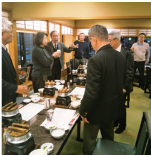
浅野副会長のあいさつ