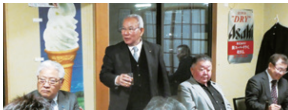
大澤副会長のあいさつ