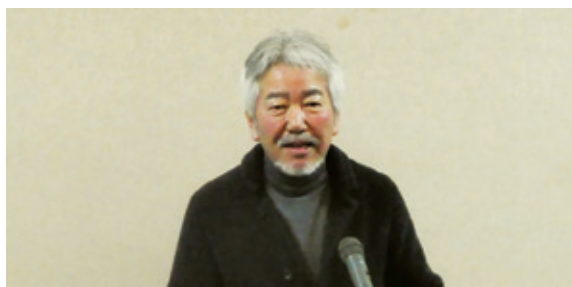
懇親会であいさつする坂巻副会長