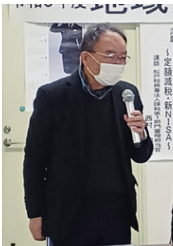
駒野ブロック長のあいさつ