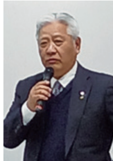
大川会長のあいさつ