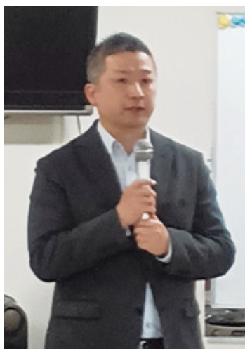
署大下1統括のあいさつ