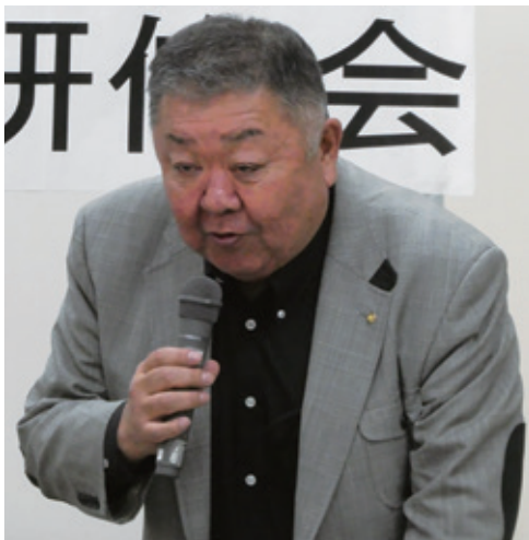
星本ブロック長のあいさつ