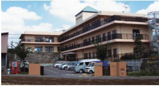
まつぼっくり全館

社会福祉法人まつど育成会は2016年に松戸市に「まつぼっくり」という入所施設を設立しました。「松戸手をつなぐ育成会」という親の団体があります。障害を持つ親たちは、常に「親亡き後」をテーマに我が子が安心して暮らせることを願います。その思いが形となって法人が生み出され、初代の園長になりました。現在は国の考え方も大きく変わり、「入所施設」という大きな集団ではなく、グループホームや一人暮らしを推奨しています。そのような状況もあり「まつぼっくり」は入所施設として許可された最後の入所施設となりました。親の想いは想いとして、障害があってもひとり一人が暮らし方を考え、その人に合った暮らし方を目指すことが大切なことです。まつど育成会では設立当初から、あえて「通過型」とし、入所施設が必ずしも終の棲家ではないという視点で支援を継続してきました。