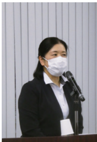
高野副署長のあいさつ