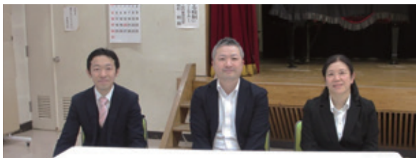
署の幹部のみなさん