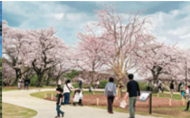
柏市あけぼの山公園さくら山再生計画・デザイン 福島県大熊町大川原地区復興拠点の公共空間デザイン