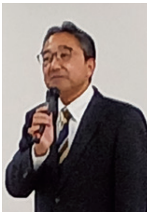
東山署長のあいさつ