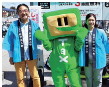
イータ君を囲んで 応援いただいた 東山署長・高野副署長