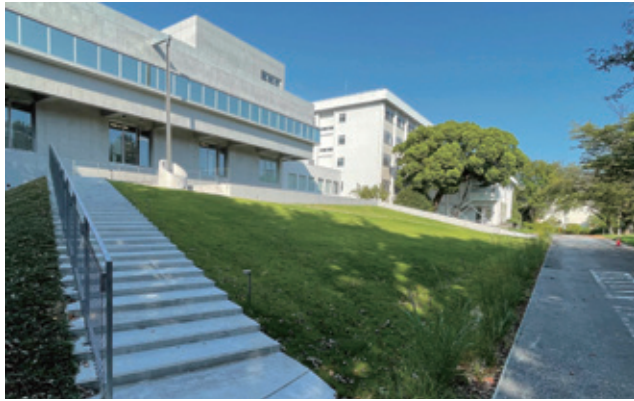
千葉大学園芸学部（松戸キャンパス）緑のテラスのデザイン GOOD DESIGN AWARD