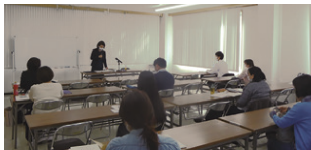
牧島講師による研修の様子