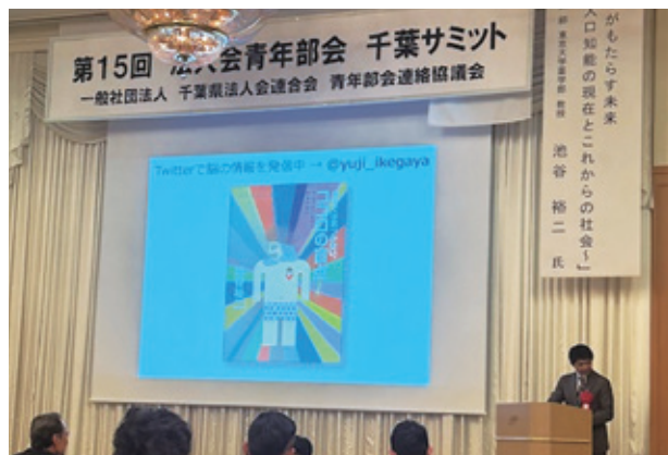
池谷氏の講演の様子