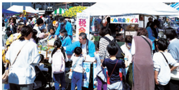
税金クイズで親子連れでにぎわう様子