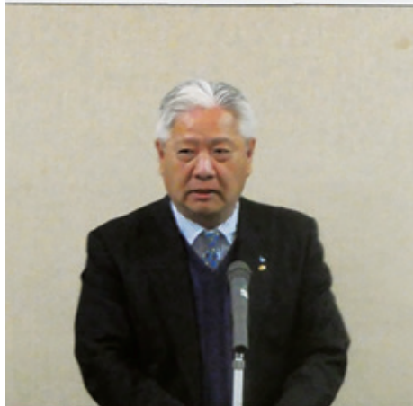
大川会長のあいさつ